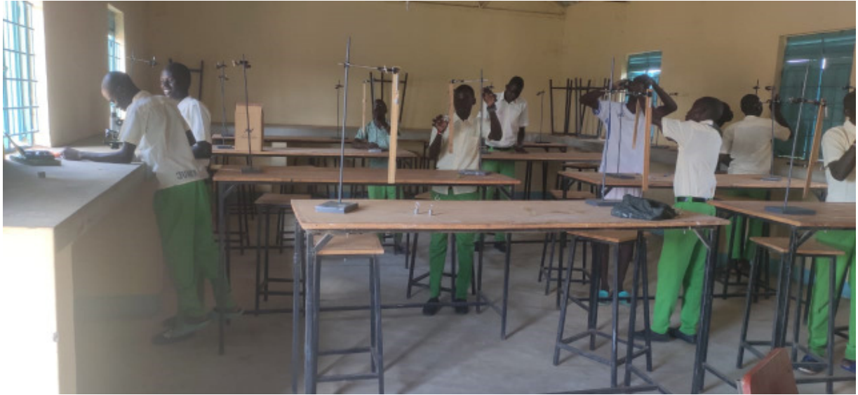
Die Schüler der St. Patrick's Boys Secondary School in Nadapal stellen mit ihrem Lehrer die naturwissenschaftlichen Geräte im Labor auf