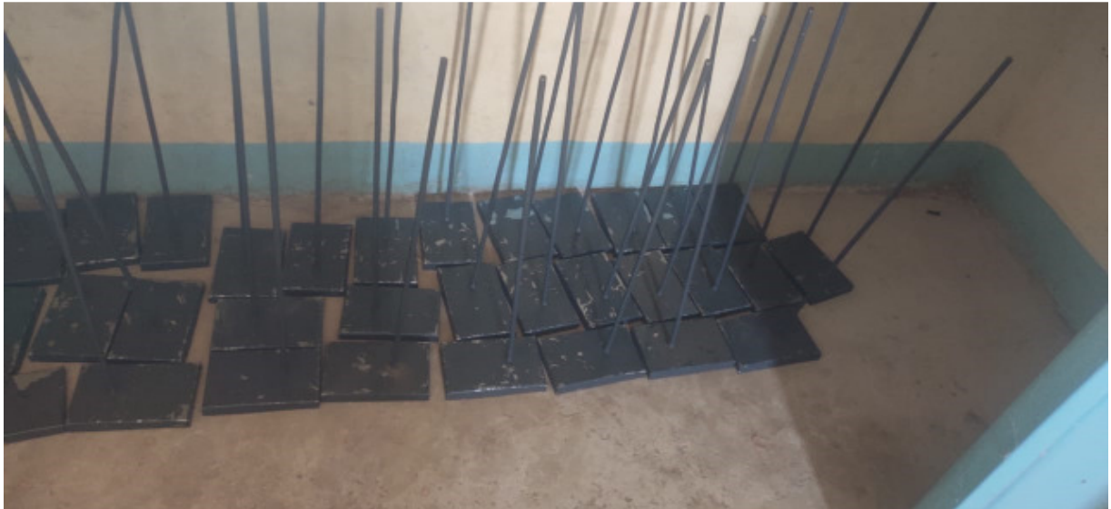
Neue Apparate für das Wissenschaftslabor