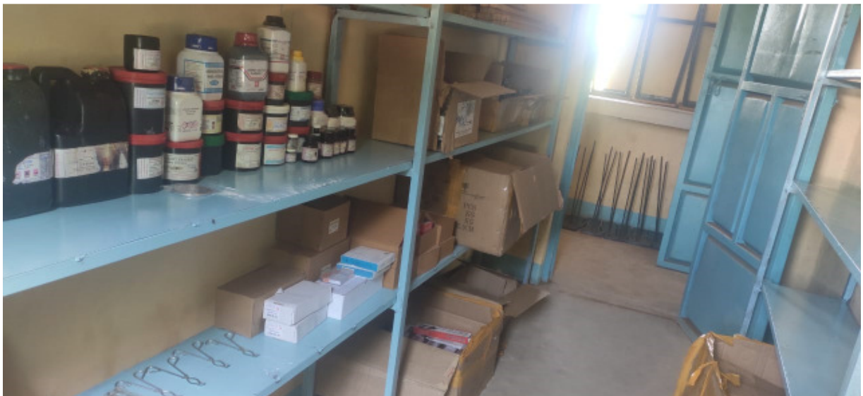
Die wissenschaftlichen Chemikalien im Laborlager der St. Patrick's Boys Secondary School in Nadapal, Südsudan